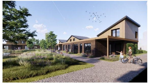
Voorzijde van de grondgebonden woningen