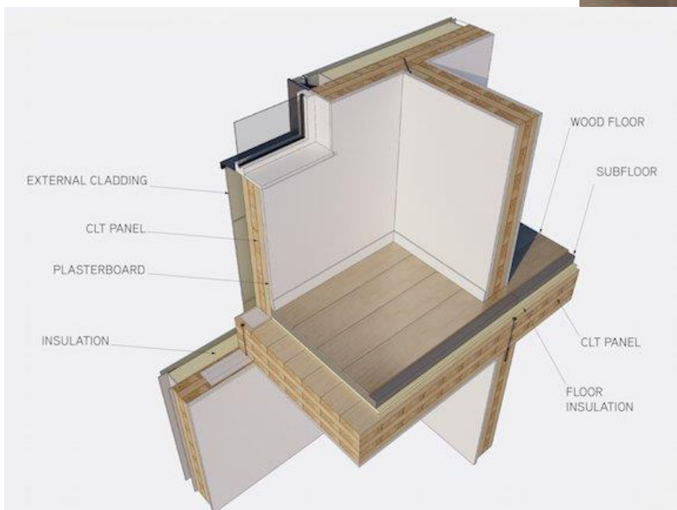
Impressie van de toepassing